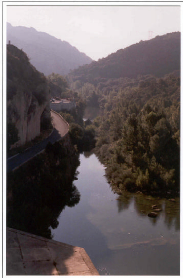
Río Ebro aguas abajo de Sobrón.