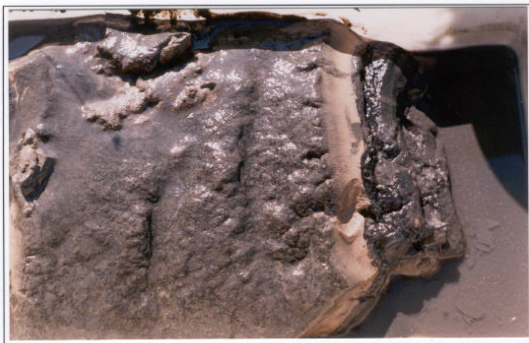
Sedimento del embalse de Sobrón, extraído en las proximidades de la presa el día 4 de septiembre de 1996.