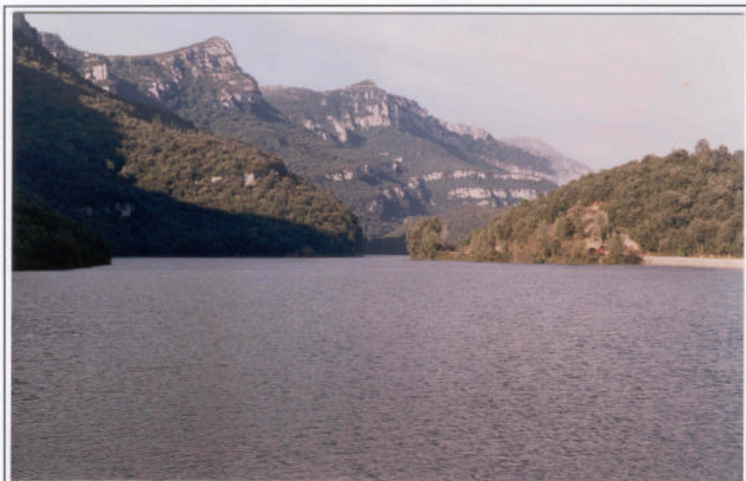
Embalse de Sobrón.